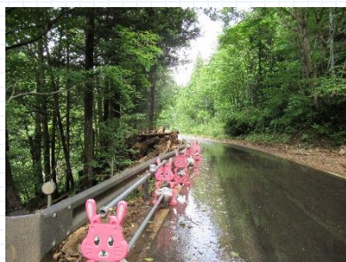
薬研エリア内の土砂崩れ

令和3年8月9日から10日にかけて発生した豪雨により、下北ジオパークでは、薬研エリアの川・道路沿いの土砂崩れ、風間浦エリア一帯の道路の寸断などの被害が発生しました。下北ジオパーク推進協議会事務局では、8月24日に薬研エリア・ちぢり浜エリアの現地確認を行いました。今後も継続して状況確認・情報発信を行っていきます。