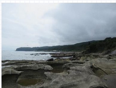
ちぢり浜は大きな被害なし