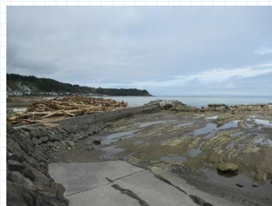
流木の撤去作業が進行中