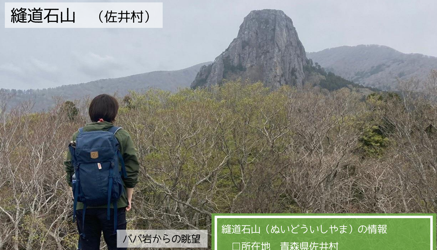
ババ岩からの眺望