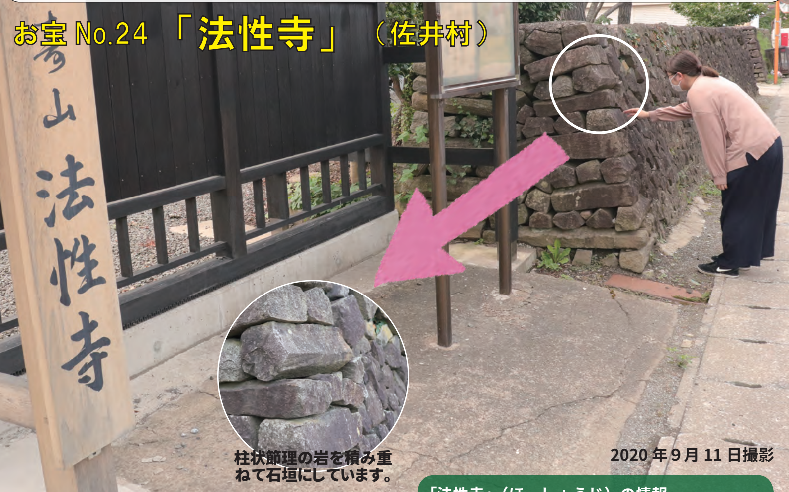
柱状節理の岩を積み重ねて石垣にしています。